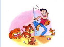
โรคพิษสุนัขบ้าได้